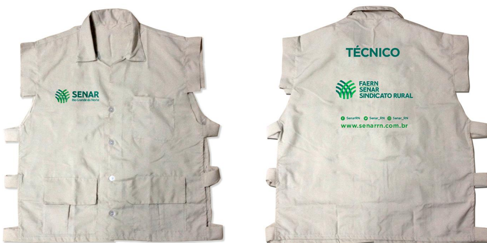
Figura 4 COLETE TÉCNICOS