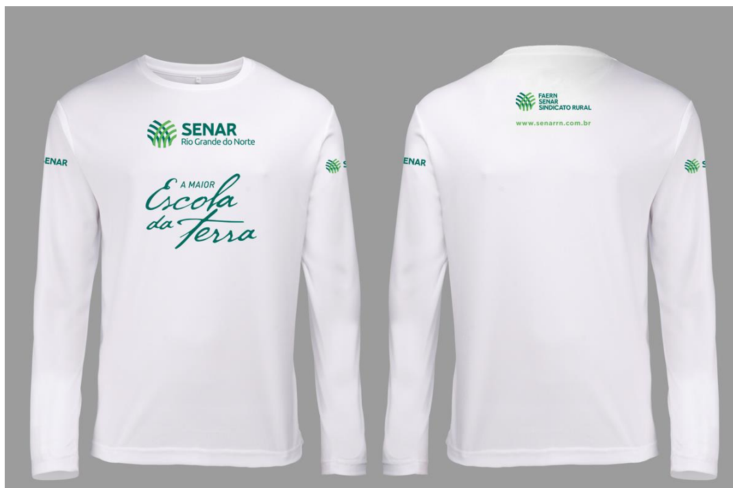
Figura 2 CAMISETA MANGA LONGA