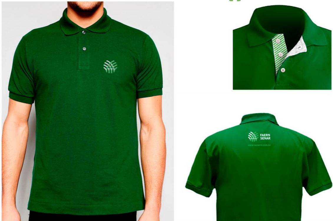
Figura 5 CAMISETA POLO