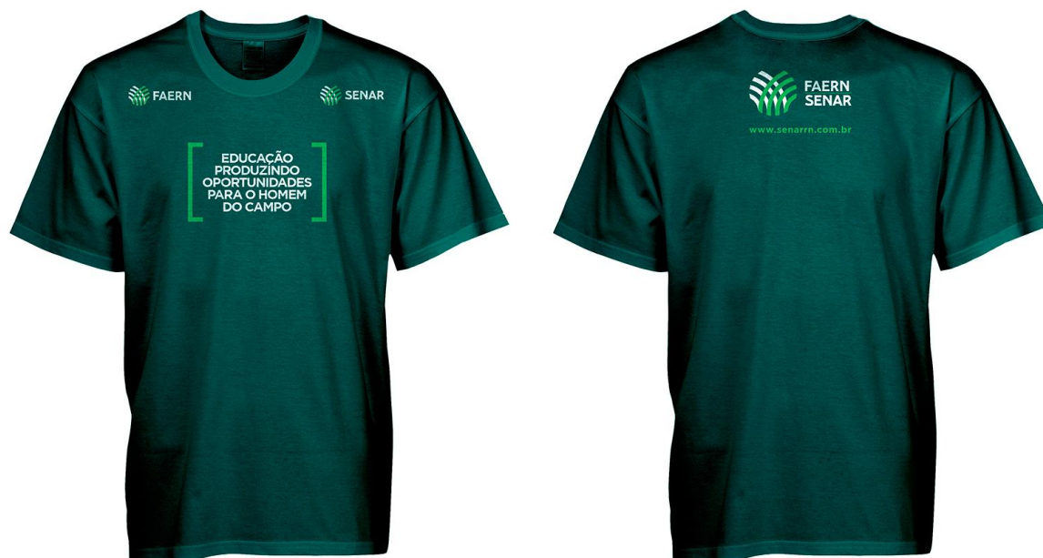
Figura 1 CAMISETA MANGA CURTA