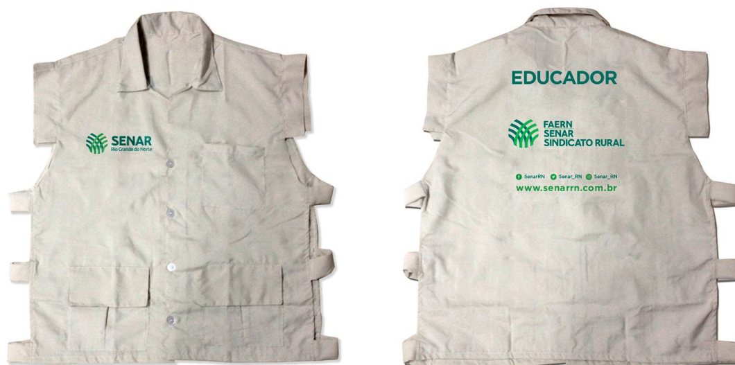
Figura 3 COLETE EDUCADORES