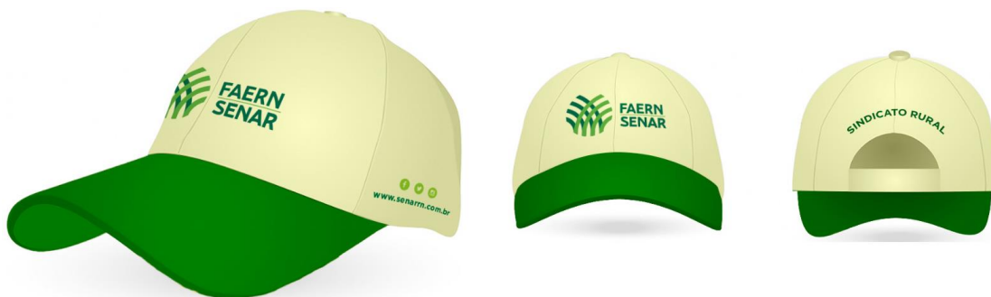
Figura 6 BONÉS